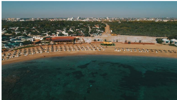
Пляж Йени Богазичи