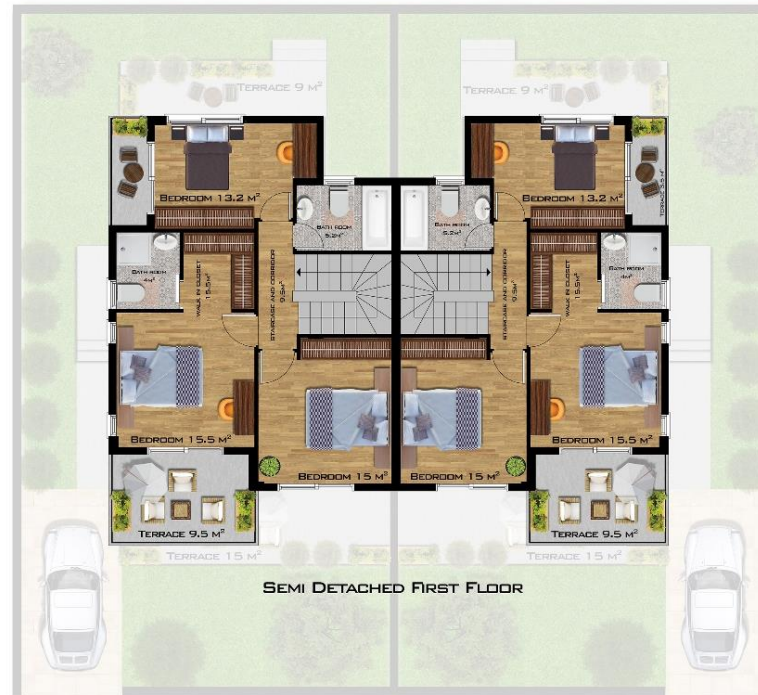
SEMI DETACHED FIRST FLOOR