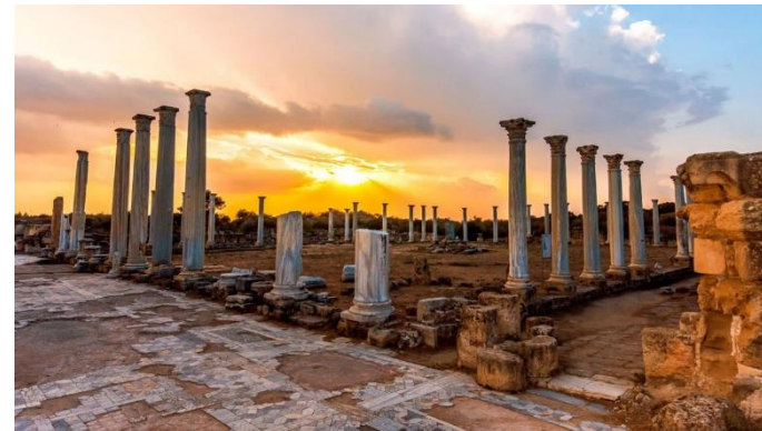
Руины античного города Саламис