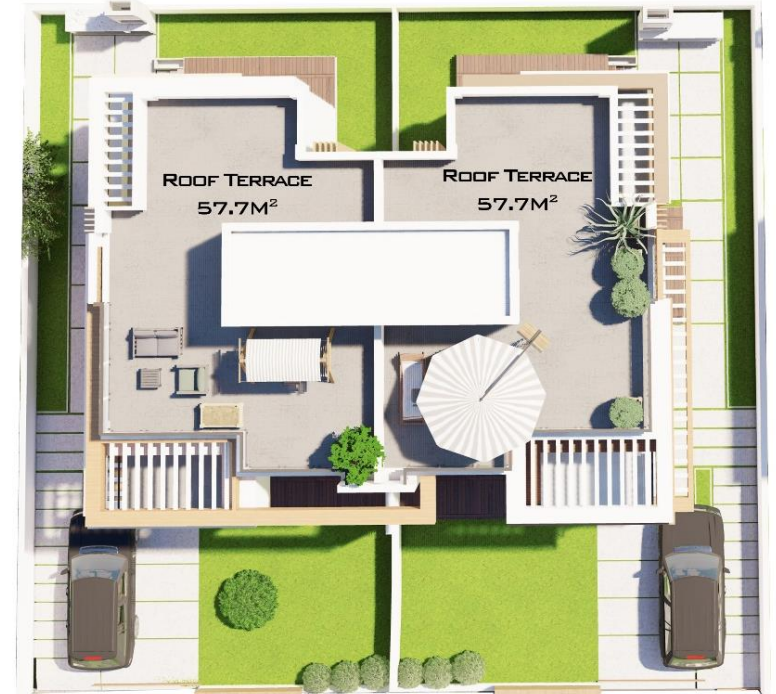
ТЕРАССА НА КРЫШЕ