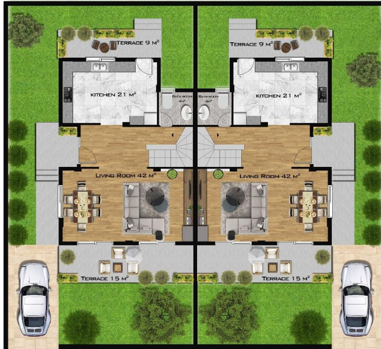
SEMI DETACHED GROUND FLOOR